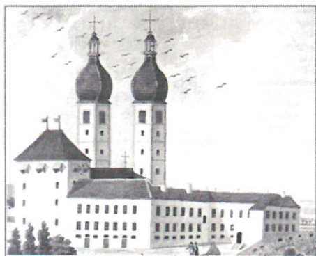
Fig. 5. L'abbaye en 1788. Peinture conservée au Musée Lorrain